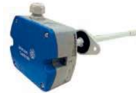
HT-1300系列电子湿度传感器